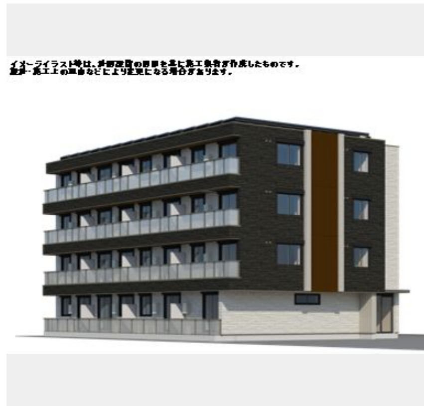
イメージイラスト等は、外部環境の図面を基に施工業者が作成したものです。建前・施工上の誤差などにより実際になる場合があります。