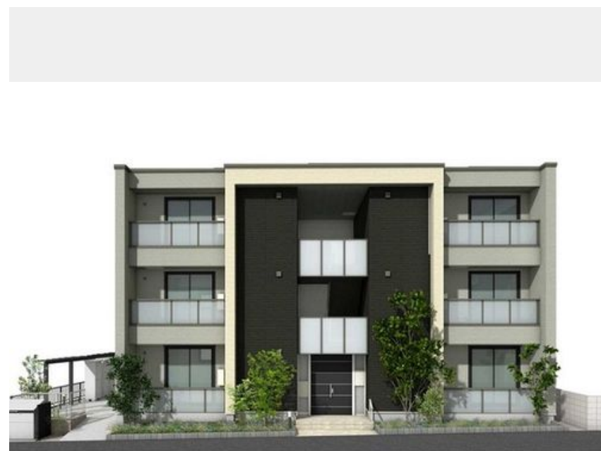
イメージバースとなります。実際とは異なります。