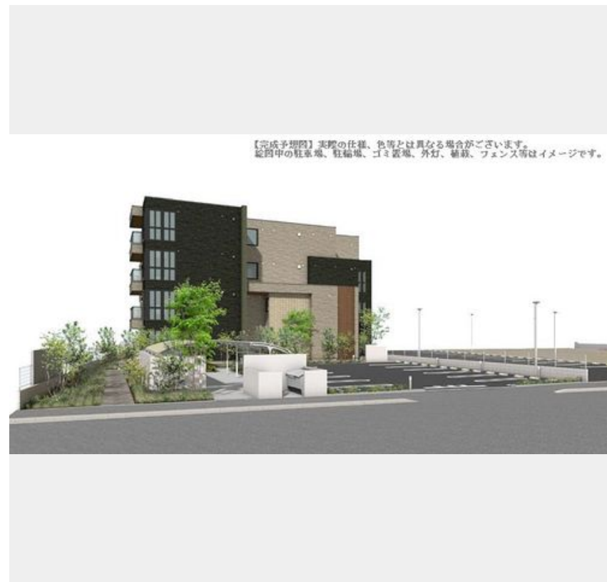
【完成予想図】実際の仕様、色等とは異なる場合がございます。総4階の駐車場、駐輪場、ゴミ置場、外灯、植栽、フェンス等はイメージです。