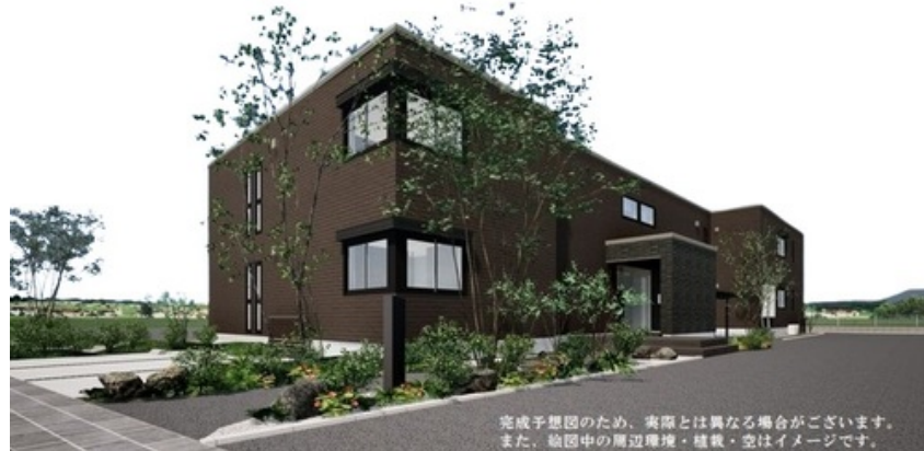
完成予想図のため、実際とは異なる場合がございます。また、図中の周辺環境・植栽・空はイメージです。