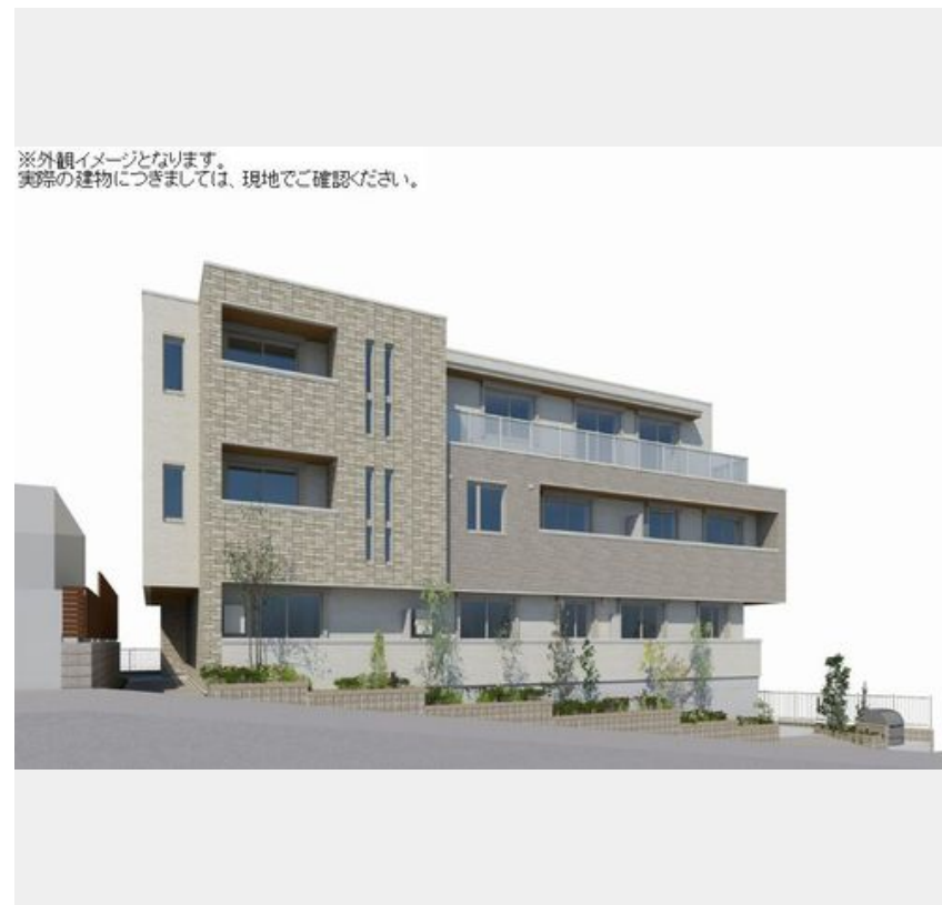
※外観イメージとなります。実際の建物につきましては、現地でご確認ください。