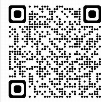
【シャーメゾンZEHタイプ】こちらをご参照ください