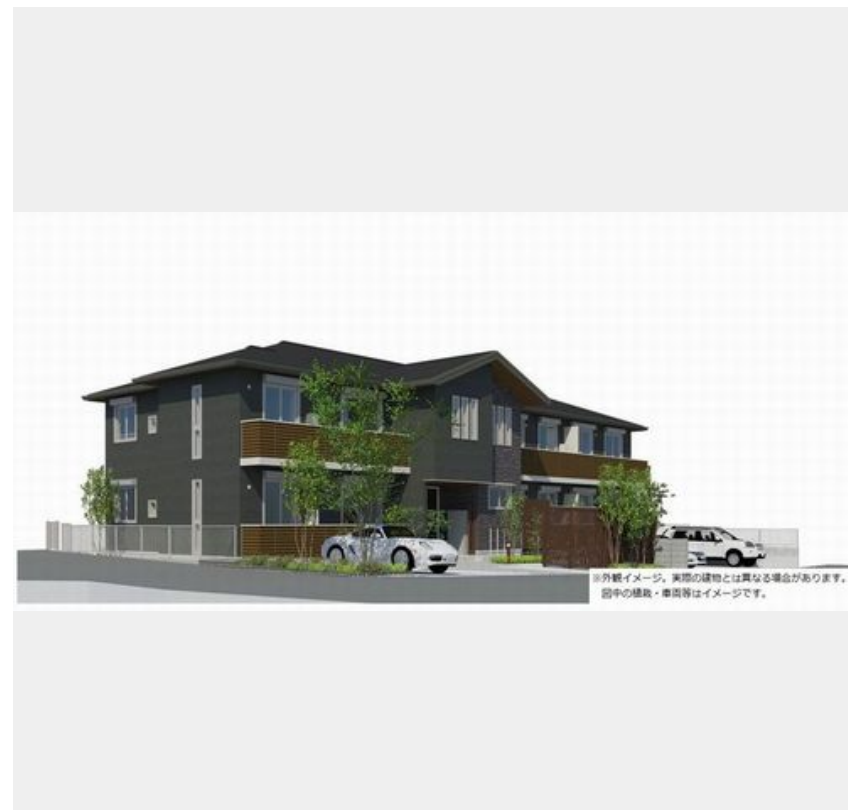
※外観イメージ。実際の建物とは異なる場合があります。図中の植栽・車等はイメージです。