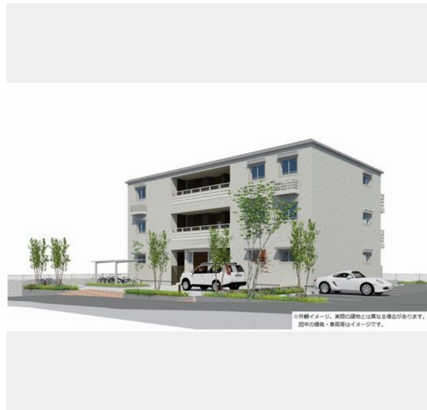
※外観イメージ。実際の建物とは異なる場合があります。図中の植栽・車庫等はイメージです。