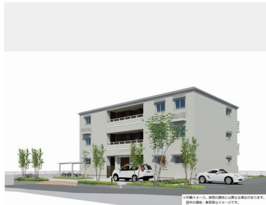
※外観イメージ。実際の建物とは異なる場合があります。図中の植栽・車庫等はイメージです。