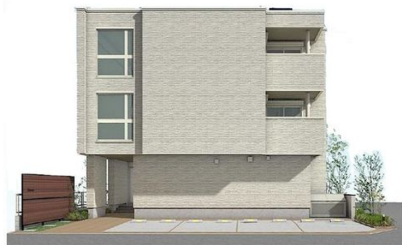
外観・植栽・ゴミボックス等 実際の仕様とは異なる場合がございます。