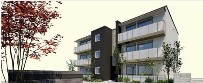
完成予想図のため、実際とは異なる場合がございます。また、絵图中的の周辺環境・植栽・空はイメージです。