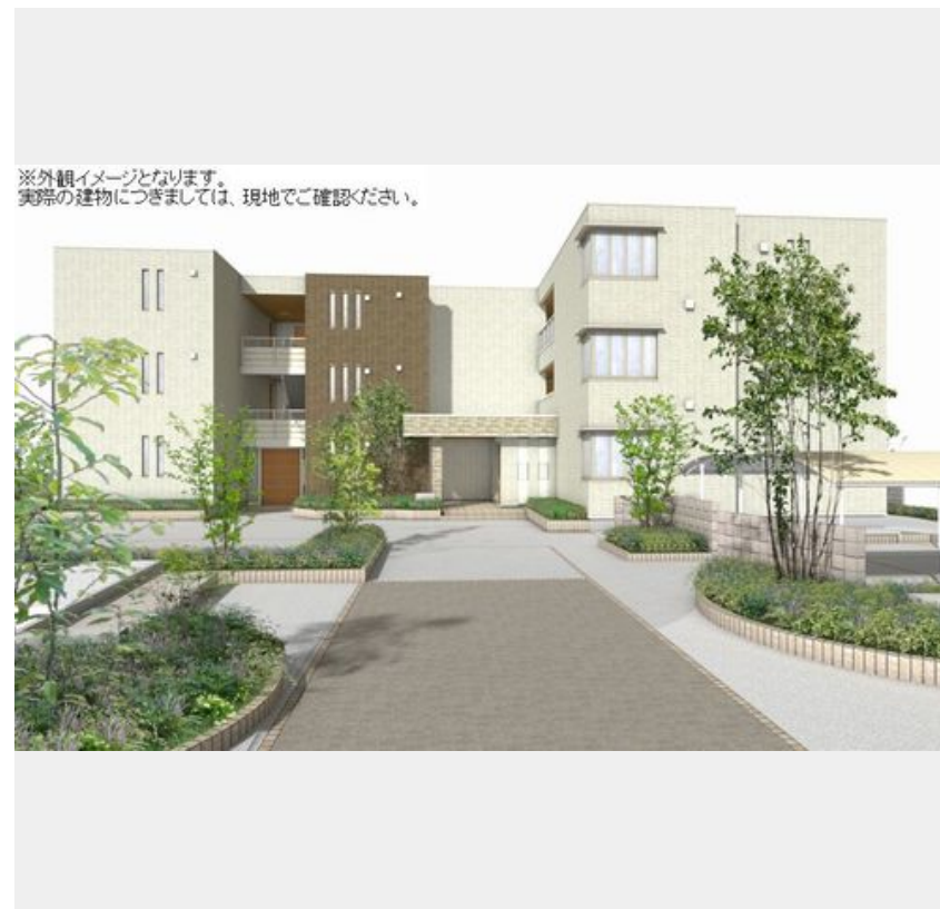
※外観イメージとなります。実際の建物につきましては、現地でご確認ください。